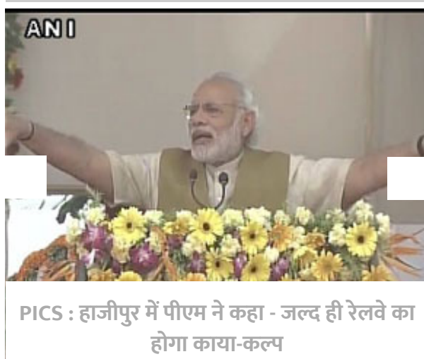
PICS : हाजीपुर में पीएम ने कहा - जल्द ही रेलवे का होगा काया-कल्प